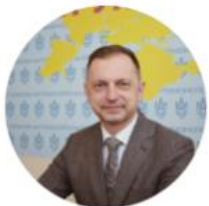
Шершун Сергій Миколайович

Заступниця Голови Антимонопольного комітету України - державна уповноважена