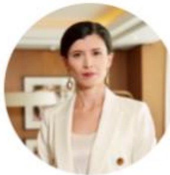
Піщанська Ольга Станіславівна

Перша заступниця Голови Антимонопольного комітету України - державна уповноважена