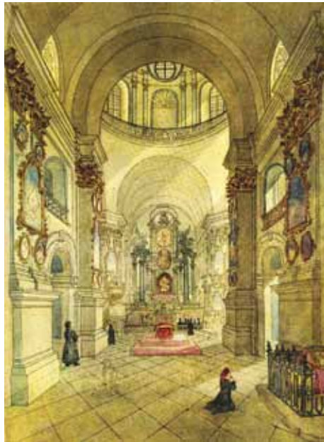
Т.Г. Шевченко. Собор Почаївської Лаври (внутрішній вигляд), акварель, 1846 р.