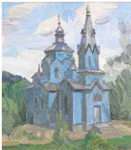
Картина брата Софії - Сергія Пазізіна, випускника ТНЕУ

Як художник, Т.Г.Шевченко закінчив Петербурзьку Академію Мистецтв і, повернувшись до України, пристає на пропозицію бути художником Археографічної комісії при Київському університеті. Виконує програму цієї комісії, у 1846 році Шевченко побував на Тернопільщині – у Вишнівці, в Почаєві, в Кременці, у Білокриниці.