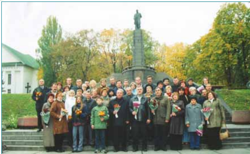
Великому Кобзареві на Чернечій Горі вклонилися університети... Фото - Михайла Бенча (із фотовиставки «Свою Україну любіть...», яка працювала у головному корпусі ТНЕУ і була приурочена ювілею Т.Г.Шевченка)