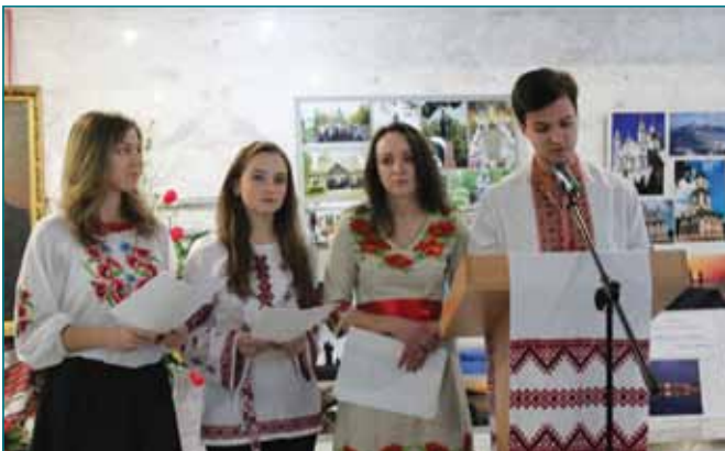
У рамках святкування 200-річчя з Дня народження Тараса Григоровича Шевченка у ТНЕУ пройшла акція безперервного читання творів Поета. На світліні - поему Т.Шевченка «Кавказ» читають студенти ННІМЕВ ім.Б.Д.Гаврилишина

Звісно, його творчу спадщину не варто розглядати поза тогочасним суспільним життям, поза драматичною історією становлення українства. У гартівні боротьби, в складних духовних протистояннях він формувався як поборник свободи і водночас як митець, але незмінною – упродовж усього життя – була у його натхненній поезії кришталево чиста правдивість та ідейна могутність українського слова.