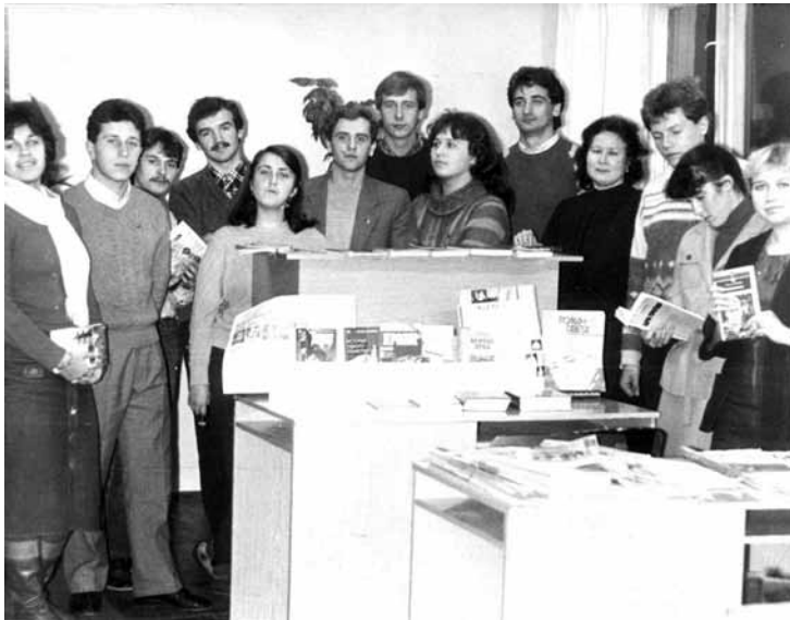
Група ФК-21 в бібліотеці