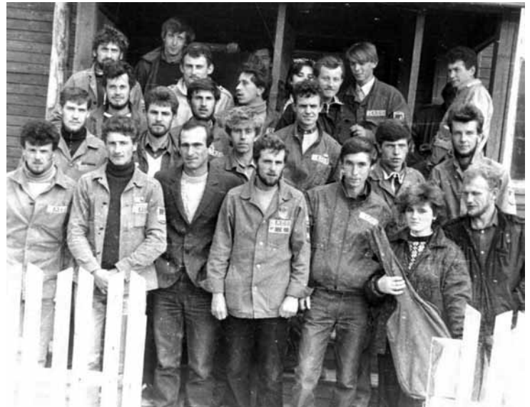
Тюмень, серпень 1987 р. (студентський будівельний загін)