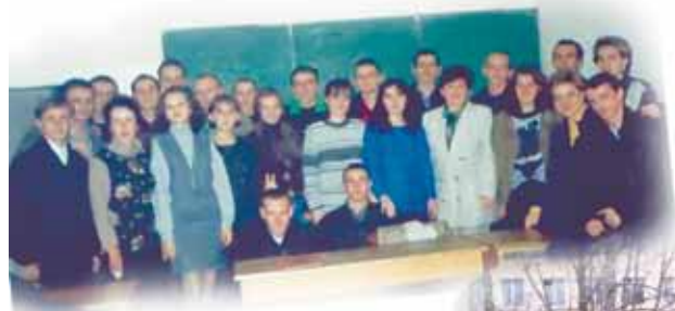
Фото на згадку зробили третьокурсники після пари, 1999 рік, група АМ-51