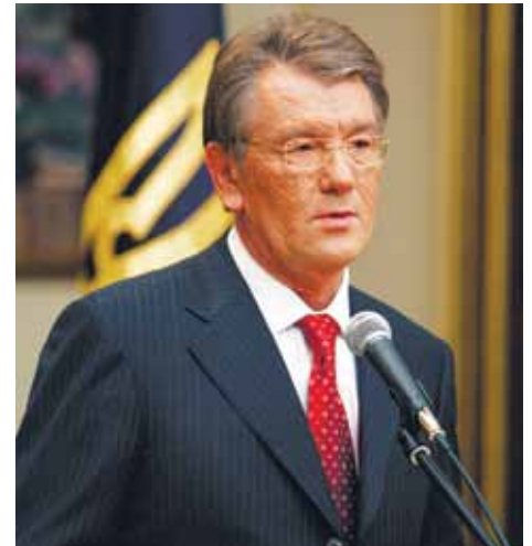
Ющенко Віктор Андрійович - випускник 1975 р.в., ФАЕМ, БС-42 Президент України (2005-2010 рр.)