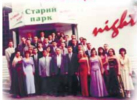
внизу - випускний груп АМ-51, АМ-52, 2001 рік