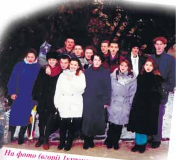
На фото (вгорі) І курсники - на перерві 1997 рік група АМ-51; (внизу) 10 років після закінчення - ауд. 2015 - 2011 рік групи АМ-51, АМ-52