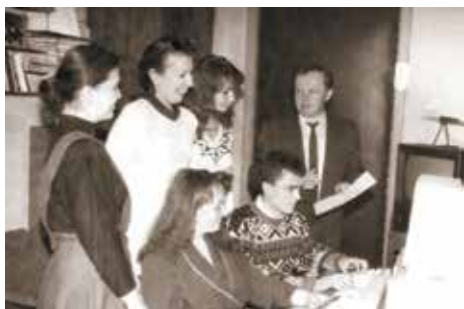
Народний танцювальний ансамбль «Пролісок»