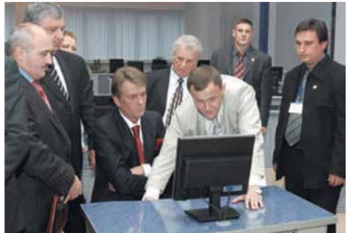
- Відкриття бібліотеки електронних ресурсів, 2006 р.