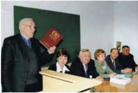
На фото: Презентація «Економічної енциклопедії», 2000 р.