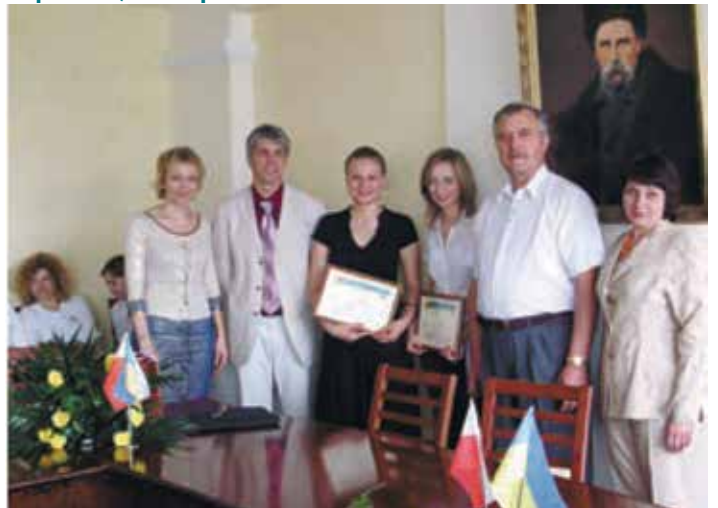
Вручення дипломів ТНЕУ студентам з Польщі-випускникам Українсько-Польської програми фінансів і страхування, 2008 р.