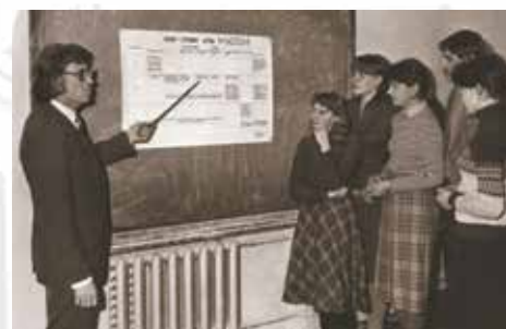
- Випускники та викладачі планово-економічного факультету