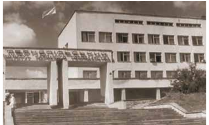
Над ТІНГ замайорів синьо-жовтий стяг, 1991 р.

Серед закордонних учених, які брали участь у вирішенні проблем перебудови навчального процесу, підвищенні кваліфікації кадрів, розвитку економічної науки в ТІНГ, слід відзначити також професора І. Геблера, який започаткував у нашому навчальному закладі викладання економічних дисциплін іноземними мовами (без перекладачів), прочитавши у 1991 р. курс лекцій німецькою мовою, провівши семінарські заняття