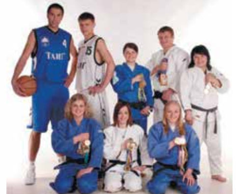
Спортивна еліта ТАНГ, 2004 р.