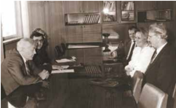
Візит професора І. Геблера