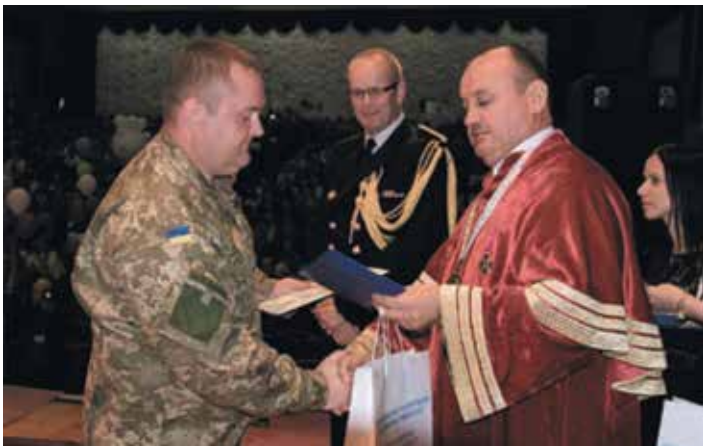
Вручення свідоцтв випускникам програми перепідготовки та підвищення кваліфікації військовослужбовців ЗСУ, звільнених у запас, та членів їх сімей, яка реалізовується у рамках проекту «Україна — Норвегія», 2015 р.