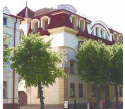
Корпус № 10

Працівники та студенти ТАНГ — активні учасники Помаранчевої революції, 2004 р.