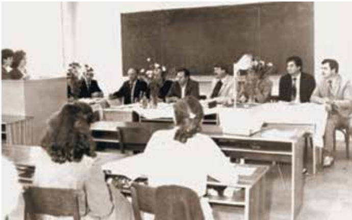
Захист комплексних дипломних робіт, 1991 р.