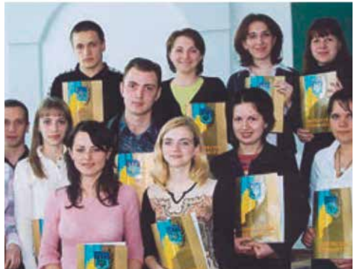
Учасники II етапу Всеукраїнської студентської олімпіади зі спеціальності «Облік і аудит», 2006 р.