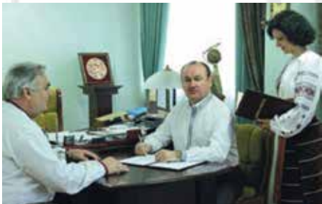
Художній колектив «Галичанка»