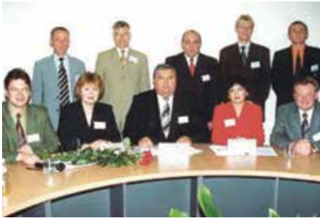
Відкриття Інтегрованої Німецько-Української програми, 2003 р.