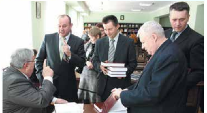
Презентація наукового видання «Фінансова думка України», 2010 р.

- Ми цінуємо минуле, але, базуючись на досягнутому, будуємо майбутнє!