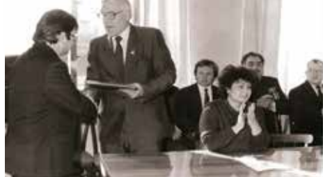
На засіданні вченої ради інституту, 1988 р.