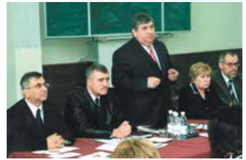
Адміністрація ТАНГ, 2003 р.