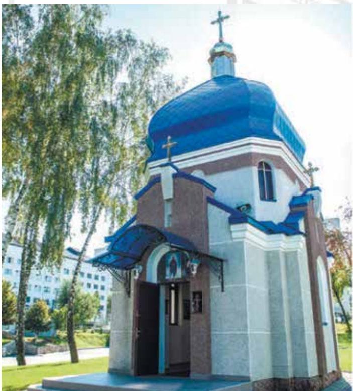
Капличка Різдва Пресвятої Богородиці на території ТНЕУ

Діяльність Тернопільського національного економічного університету визначається Конституцією України, Законами України («Про освіту», «Про вищу освіту», «Про наукову і науково-технічну діяльність»), указами Президента України та постановами Верховної Ради України, актами Кабінету Міністрів України, наказами Міністерства освіти і науки України, Національною стратегією розвитку освіти в Україні на 2012–2021 рр., Державною цільовою науково-технічною та соціальною програмою «Наука в університетах» на 2008–2012 рр., Національною рамкою кваліфікацій, Статутом університету тощо.