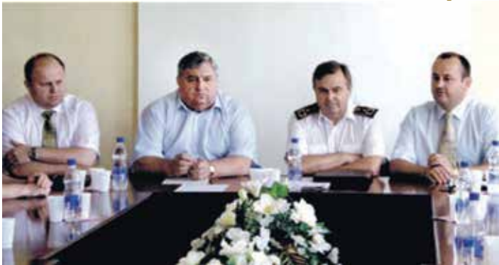
Комісія з розподілу випускників кафедри податків і фіскальної політики на роботу в органи Митної служби України, 2007 р.