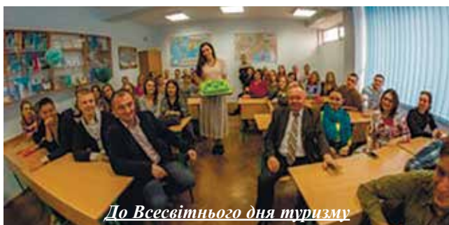
До Всесвітнього дня туризму