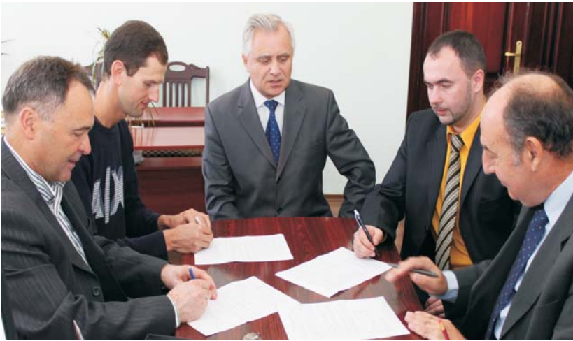
На фото: мить підписання меморандуму

Днями горизонти співпраці ТНЕУ із закордонними вищими навчальними закладами розширилися, коли до нашого університету завітав декан факультету фізики університету Аристотеля міста Салоніки, професор Теодор Лаопулос, який під час зустрічі з проректором ТНЕУ