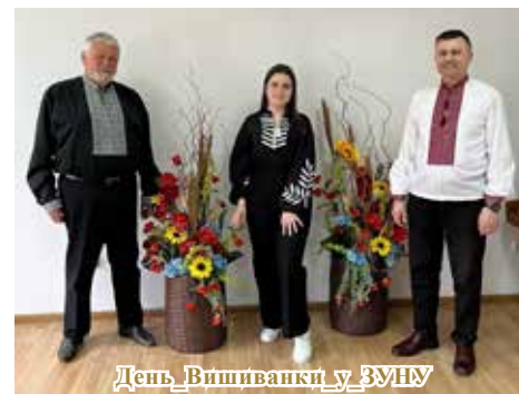
День Вишиванки у ЗНУ

Як музичний інструмент, коли ми чуємо його здалеку, видається нашому вухові приємніший, так і бесіда з відсутнім другом буває звичайно набагато любішою, аніж із присутнім. (Григорій Сковорода)