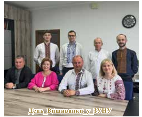
День Вишиванки у ЗУНУ

в нашому університеті. За період мого навчання цей навчальний заклад дав велику базу знань завдяки яким можна з комфортом працювати за фахом.