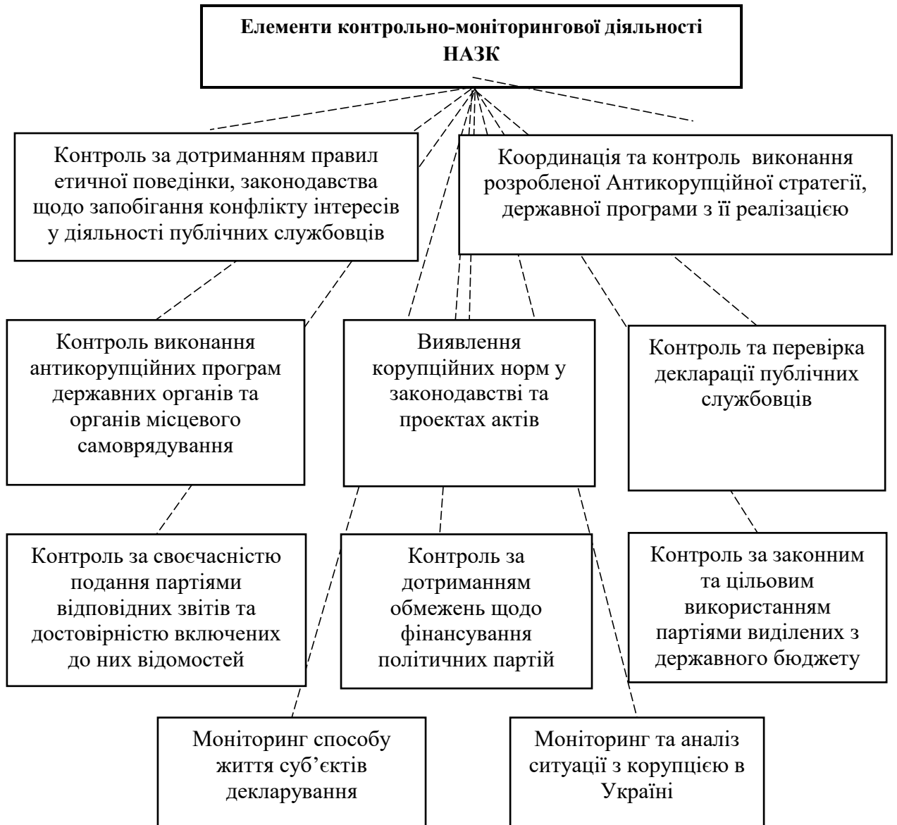
Рис. 1. Елементи контрольно-моніторингової форми діяльності НАЗК*